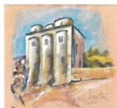
chiesa di San Marco (metà dell'XI secolo)

ISTITUTO COMPRENSIVO STATALE "A. AMARELLI" VIA GRAN SASSO n. 16 - 87068 ROSSANO - TEL.0983512197 - FAX 0983291007